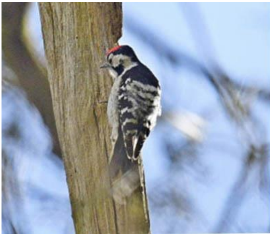
Kleine bonte Specht