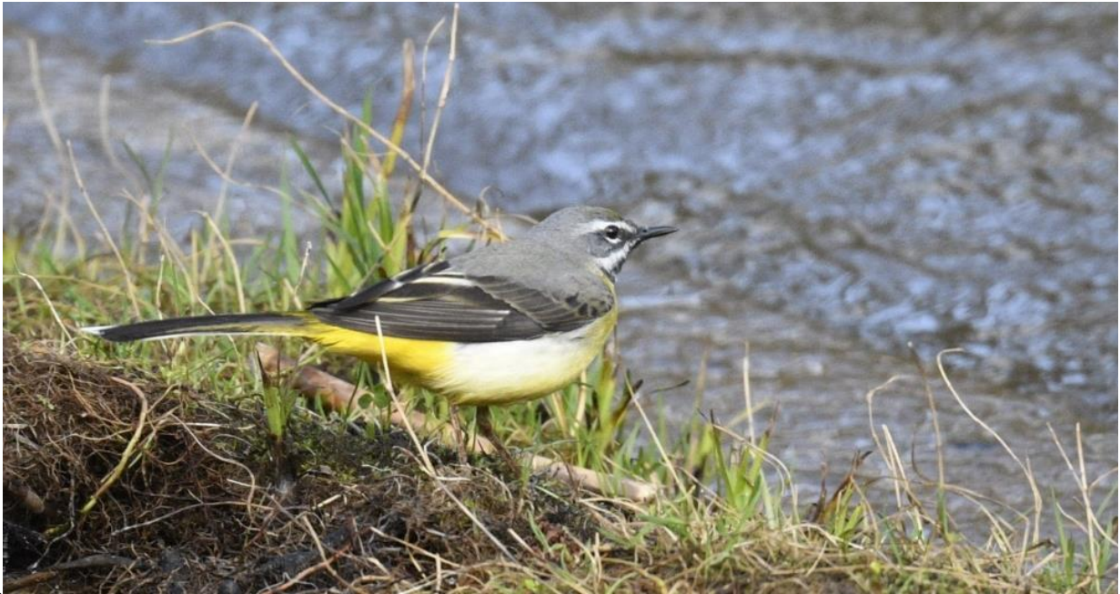
Mooi poserende Grote gele kwikstaart