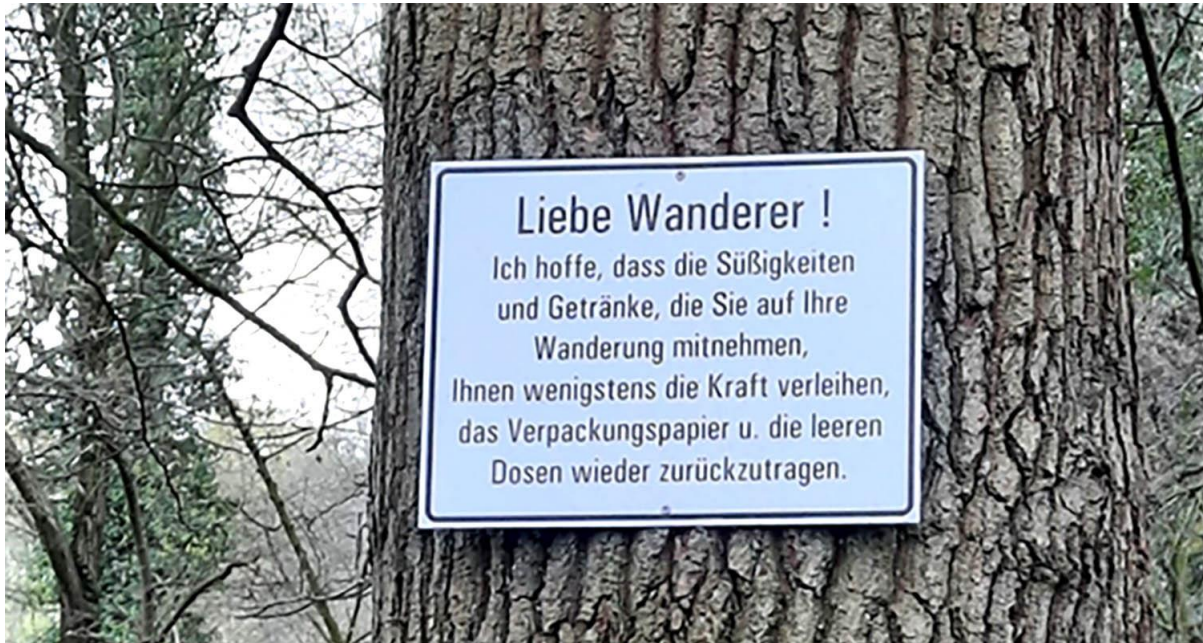
Tijdens de wandeling kwamen we dit bordje ook nog tegen!

De lijst van waarnemingen van deze excursie.