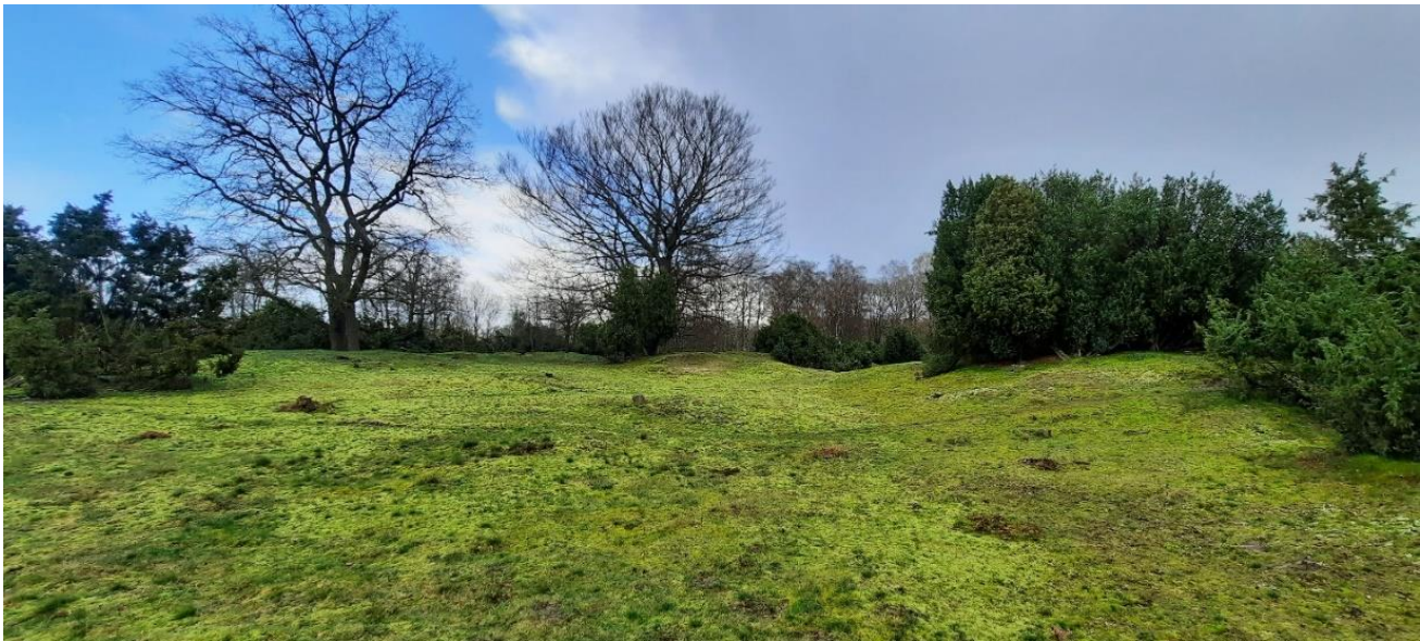
Rivier duintjes met Jeneverbesstruwelen

Al gauw weken we van dat pad af en over de brug liepen we aan de overkant langs de Vecht. Hier hadden we de eerste Grote gele Kwik en Vuurgoudhaantje. In de bossen zeker 5 Middelste bonte spechten en de nodige flora als b.v. Grote muur, Bosanemoon en Donkersporig Bosviooltje.