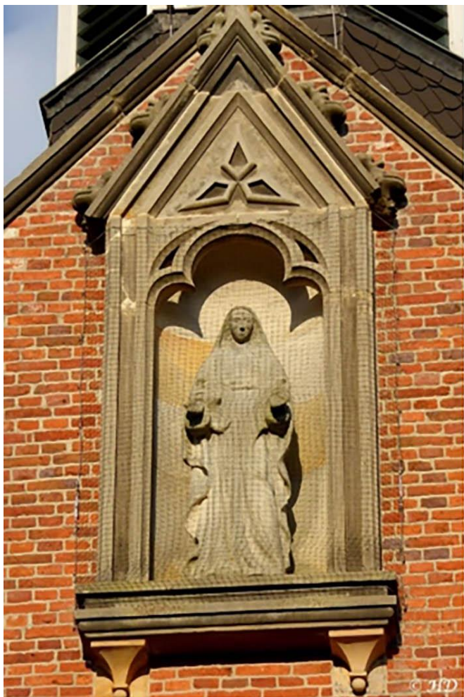
Beeld van Maria aan de kerk