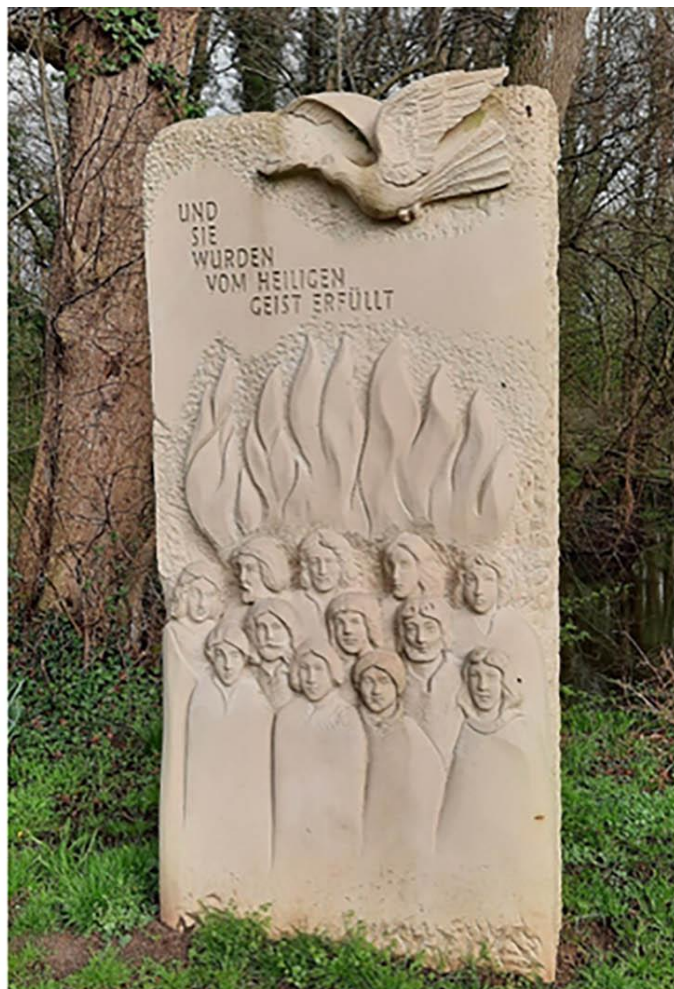
Betekenis van Pinksteren afgebeeld

We begonnen de wandeling in Gut Brandlecht bij het St. Maria kerkje, liepen een klein stukje van het processiepad met beelden van bijbelse voorstellingen, en begonnen met o.a. een 3-tal Appelvinken, Muskuskruid en Schedegeelster.