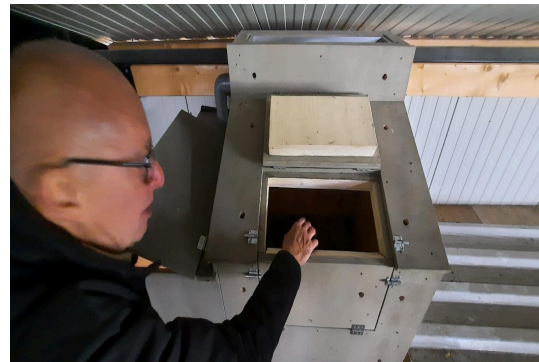
De eigenlijke nestplaats.

Waarschijnlijk zal de “eigenlijke” nestplaats nooit worden gebruikt.